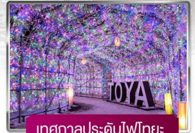
เทศกาลประดับไฟไทยะ